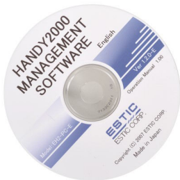
PC-Software ohne Lizenzgebühren