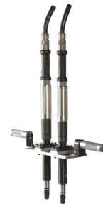
Umfangreiches Zubehör direkt von ESTIC

Bei der EH2-Serie von Estic handelt es sich um eine EC-Schrauberserie mit eingebautem Drehmoment-Drehwinkel-Sensor. Dadurch erreichen Sie für Ihre Verschraubung die höchstmögliche Genauigkeit und Sicherheit. Die Messwerte sind archivierbar und rückführbar nach ISO5393.