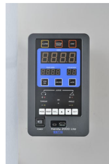
Eine Steuerung für alle Drehmomente und Schrauberformen