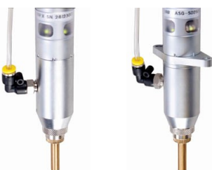
Passende Vakuum-Mundstücke für Edelstahlschrauben oder Schraubautomaten