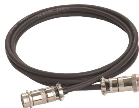
Anschlusskabel in unterschiedlichen Längen, auch ESD-konform