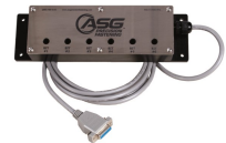
Umfangreiches Zubehör direkt von ASG

Bei der SD2500-Serie von ASG handelt es sich um eine EC-Schrauberserie mit eingebautem Drehmoment-Drehwinkel-Sensor. Dadurch erreichen Sie für Ihre Verschraubung die höchstmögliche Genauigkeit und Sicherheit. Die Messwerte sind archivierbar und rückführbar nach ISO5393.