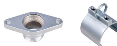
Flanschplatten oder Aufhängungen