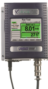
Touch Panel Programmierung