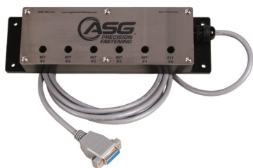
Plug and Play Bitkästen mit 4 oder 8 Einsätzen