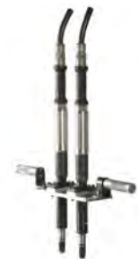
Umfangreiches Zubehör direkt von ESTIC

Bei der EH2-Serie von Estatic handelt es sich um eine EC-Schrauberserie mit eingebautem Drehmoment-Drehwinkel-Sensor. Dadurch erreichen Sie für Ihre Verschraubung die höchstmögliche Genauigkeit und Sicherheit. Die Messwerte sind archivierbar und rückführbar nach ISO5393.