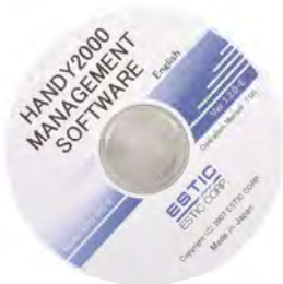
PC-Software ohne Lizenzgebühren