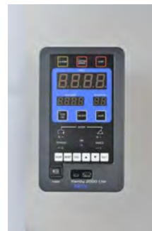
Eine Steuerung für alle Drehmomente und Schrauberformen